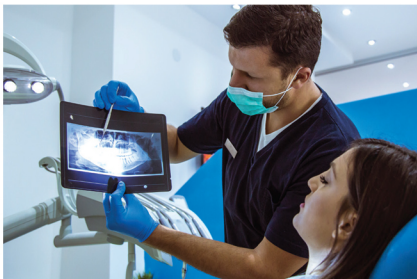
KLINIK DOKTER GIGI