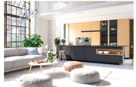
CAFE / RESTAURANT